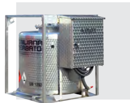
TFT 330 INOX: резервуар из нержавеющей стали Inox для перевозки топлива.