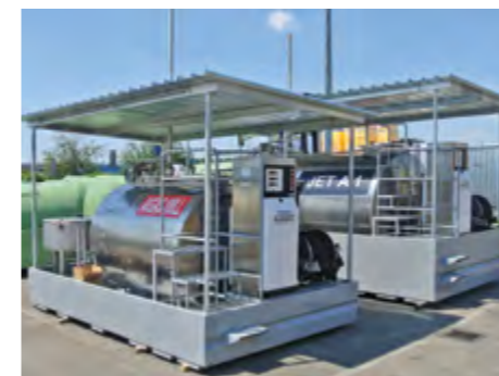
TFT 910 INOX: stainless steel tank for fuel transport.