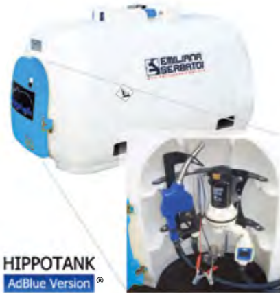
HIPPOTANK AdBlue Version®

[EN] Portable tanks made in polyethylene for transport and delivery of DEF.