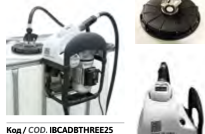
Код / COD. IBCADBTHREE25