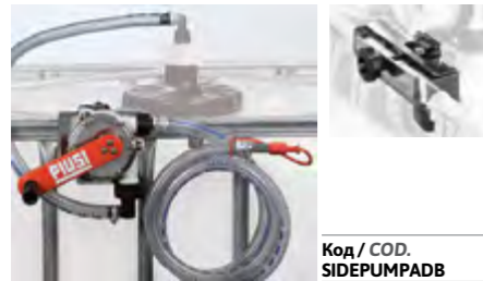
Код / COD. SIDEPUMPADB