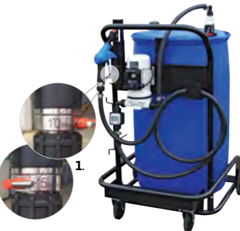
1. регулирующего ключа с функцией дозирования 5-10 л. Flow rate 5-10 L/min adjusting key.

[EN] Special trolley for transport and delivery of DEF.