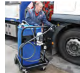
1. Электронный расходомер K24. Digital flowmeter K24.