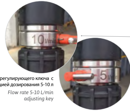
регулирующего ключа с функцией дозирования 5-10 л Flow rate 5-10 L/min adjusting key

[EN] Portable tank made in polyethylene for transport and delivery of DEF.