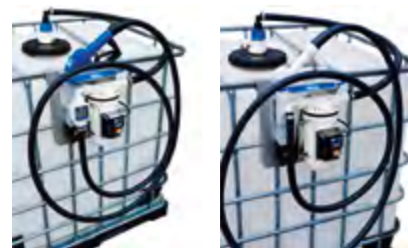
Код / COD. IBCADBSUZPRO

[EN] IBC containers made in polyethylene for transport and delivery of DEF.