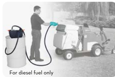
For diesel fuel only