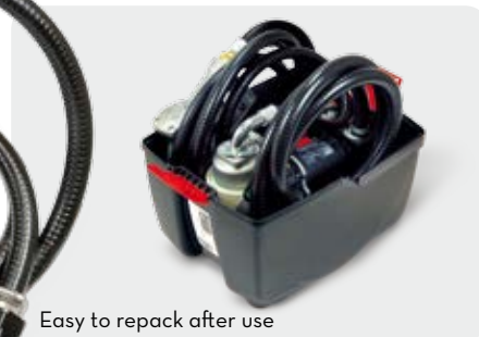
Easy to repack after use